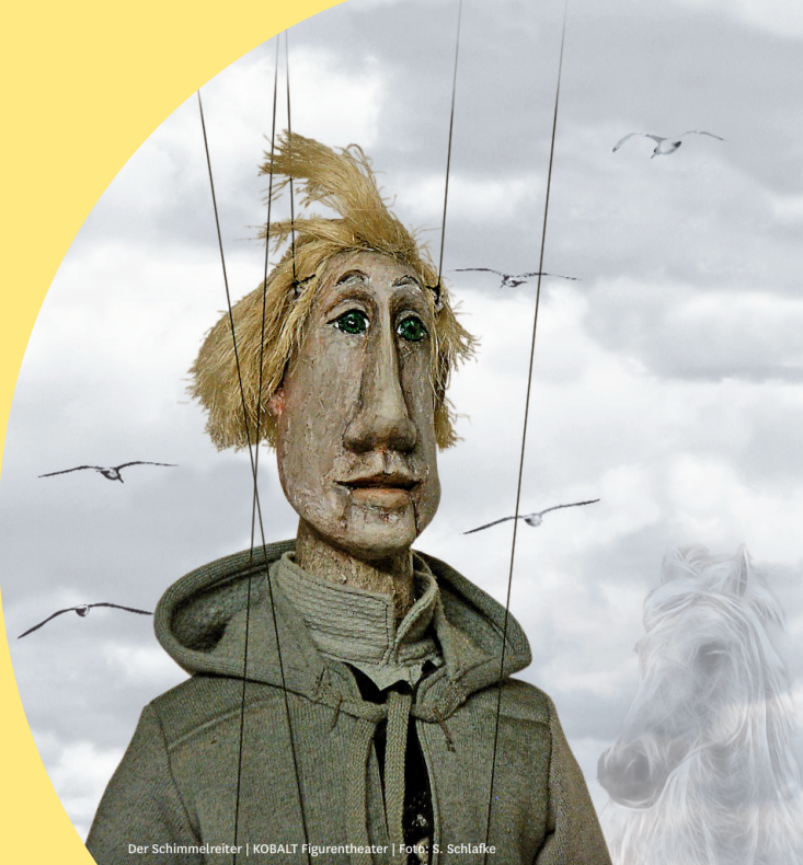
Der Schimmelreiter | KOBALT Figurentheater