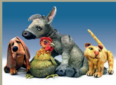
Die Bremer Stadtmusikanten | KOBALT FT Lübeck

Topf sein Deckelchen und in PLING! – knallt volkstümliches Kaspertheater auf digitale Dramaturgie.