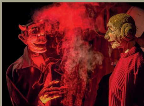
Fifty Shades of Gretel | Theater Blaues Haus

Ab dem 24. September feiern wir die Rückkehr der Geselligkeit. Die Bremer Stadtmusikanten haben ihren ersten großen Auftritt, ein Riese bandelt mit Zwerglinde an, Hans schwelgt im Glück, Piratin Elena kapert ihren Eberhard, Elch Emil sucht einen Freund, Troll Hugo verknallt sich in das Trollmädchen Paulina und der Wolf findet ein Schaf fürs Leben. Nicht nur in den Familienaufführungen geht es um die LIEBE, sondern auch für Erwachsene wird neben dem musikalischen Nummernprogramm Kleines Konzert mit großen Marionetten aus Beziehungskisten geplaudert: Fifty Shades of Gretel, Leonce und Lena, Kasperblues – Liebe, Schnaps und Rebellion. Im Weißen Rössl bekommt jeder