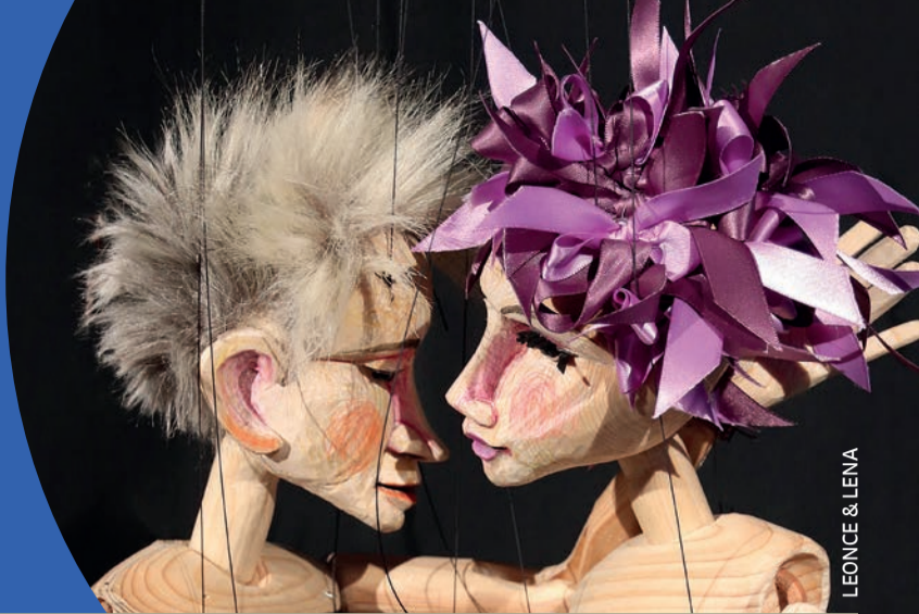
LEONCE & LENA

KOLK 17 FIGURENTHEATER & MUSEUM zu Gast im Europäischen Hansemuseum SEP – OKT 2022